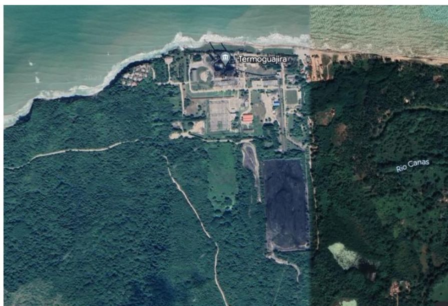
Figura 1. Vista aérea de la Central Eléctrica Termoguajira.

El vendedor deberá realizar la entrega en la Central Termoguajira, localizada en el Corregimiento de Mingueo, municipio de Dibulla, en el Departamento de la Guajira, a 75 Km. de la ciudad de Riohacha y a 90 Km. de la ciudad de Santa Marta.