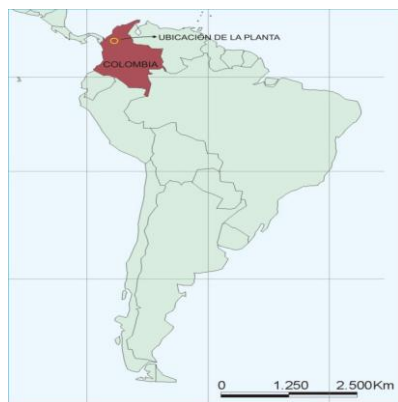
FIGURA 1. Ubicación de Colombia

El acceso a la zona de localización de la Central Termoeléctrica GECELCA 3 se hace a través de la vía que desde el Municipio de Montelíbano conduce hasta el Municipio de Puerto Libertador y antes de llegar al Municipio, a 18 km de Montelíbano se hace una desviación a la derecha en el sitio denominado “La Balastrea”, y por la vía que conduce hasta el corregimiento de Pica – Pica, aproximadamente a 8 km de “la Balastrea”, se llega hasta el predio donde se encuentra ubicada la Central Termoeléctrica GECELCA 3.