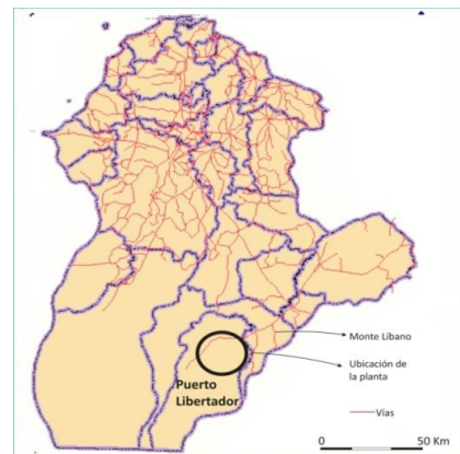
FIGURA 2. Zona de ubicación de los municipios de Montelíbano y Puerto Libertador y vías de acceso al sitio.